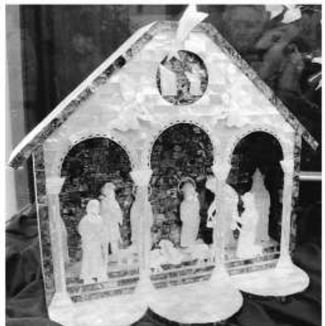
3 Fotos von Frau Sobioch