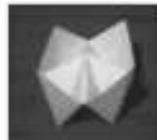
Himmel und Hölle