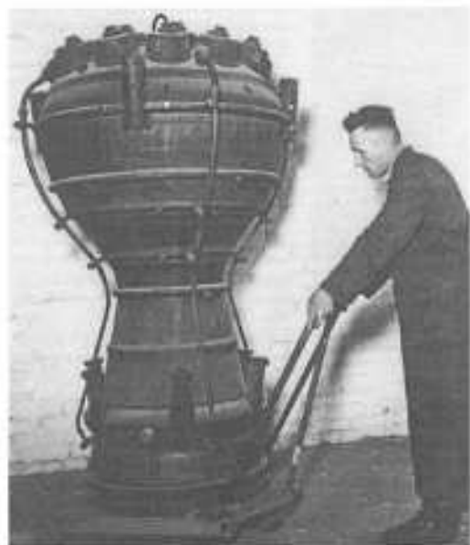
Solche "Heizbehälter" (Ofen) wurden in den Prüfständen geprüft. Der "Ofen" ist die eigentliche schubbringende Düse des Triebwerks!