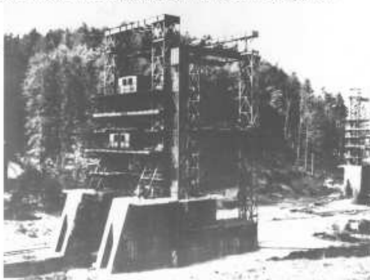
Zwei Teststände für A 4-Triebwerke in Ober-Raderach

Ich war damit beschäftigt, im Fundament-Raum von einem Raketenprüfstand das Material zu sortieren und auszugeben. Dort stand auch ein riesiger Kompressor, den ich bei Bedarf starten musste. Das war schwierig: Erst musste der große Motor in Sternschaltung anlaufen, dann bei fast voller Leistung auf Dreieckschaltung umschalten. Wenn man nicht genau den richtigen Zeitpunkt erwischte, flogen funkensprühend die Sicherungen raus. Nach Auswechselln dieser hieß es wieder von vorne anfangen. Manchmal brauchte ich einige Versuche. Außerdem musste ich eine Baracke für Kriegsgefangene installieren. Darin waren Piloten aus abgeschossenen Flugzeugen. Was mich wunderte: Das ganze Gelände war geheim und durfte nur mit Ausweis betreten werden. Aber drinnen wurde nicht kontrolliert. Ich kam durch die Materialauslieferung im ganzen Gelände herum. Einmal schaute ich mir im Kommandogebäude die Baupläne an. Aber der englische Pilot, den ich kannte, schaute sie sich auch an. Mit ihm plauderte ich manchmal, soweit mein Englisch reichte. (Walter Baerens)