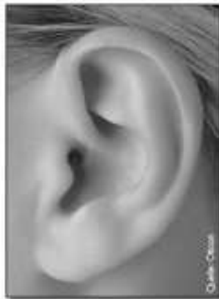
Die neuen Ohr-HiFi's: Nahezu unsichtbar.

Das Hörstudio Wolter hat dabei strenge Kriterien für die neuen Hörsysteme eingeführt. Ein Ohr-HiFi muss mindestens 4 Bedingungen erfüllen: